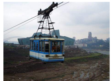
▲長江を渡るケーブルカー

重慶は山を切り開いて開発されており、街の中心には長江と、烏江、嘉陵江の 3 本の川が走り、山の上にマンションが立ち並び、山があり、川があるととても美しい街と感じられます。特徴として、交通網にロープウェーやケーブルカーといったものも活用されています。