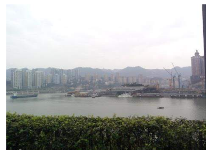
▲長江と嘉陵江の合流地

重慶市民給料は上海市民よりも、25%ほど低く、また、家賃も上海の 25%ほどという事で、生活へのストレスは上海より