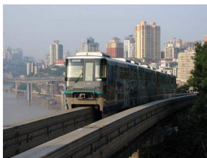
▲重慶ケーブルカー