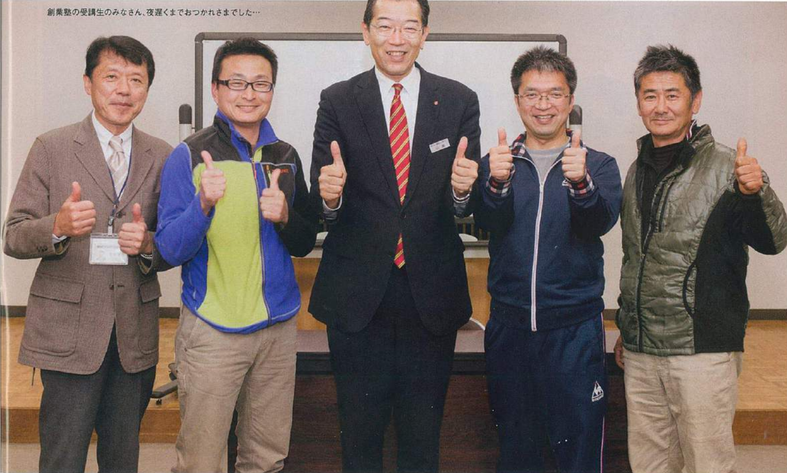
創業塾の受講生のみなさん。夜遅くまでおつかれさまでした...

1. 以前、別主催の創業者支援セミナーに出席したときは、他の参加者たちが明確な目標を持っていらして、まだ迷いがあった自分には場違いな気がしました。自分の目的が定まった今回の受講は、経営の考え方を分かりやすく説明いただき、物事の意味を整理して考えるのに役立ちました。 2. 一歩踏み込む勇気とチャレンジを! 私は、もともと郡上出身ではありません。移住して20年、2つの会社に勤め、今こうして自分が打ちこめる仕事に出会いました。開業に必要な資格も取得し、トップクラスの商品を提供できる企業の傘下に入ることができました。この仕事で人に癒しと笑顔を届けたいです。