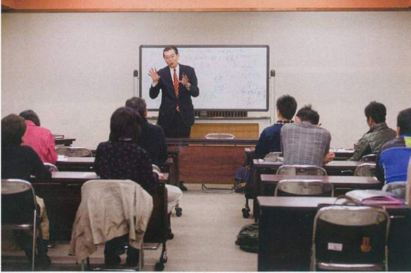
ビジネスプランの作成方法を勉強中

今年最後の特集は、さまざまなアイデアで事業を興そうと頑張る人々を紹介した。郡上市の事業者のさらなる発展を願って、来年も元気にいこう。